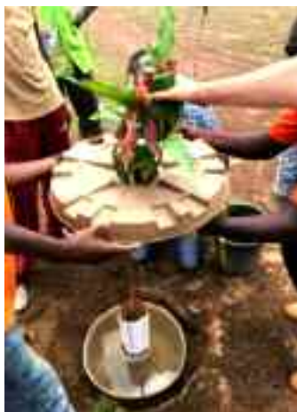
Plaatsen van jong mango-boompje in een cocoon.