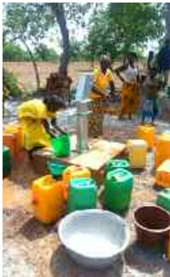
Gerealiseerd in 2018: de aanleg van twee geboorde waterputten met pomp.