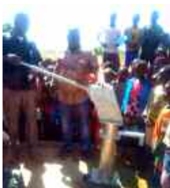
Nieuwe, duurzame rvs-pomp.