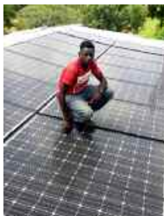
Een van de doelen voor 2019: reparatie & onderhoud van de zonnepanelen.

Net als in de afgelopen jaren heeft SMO weinig bemoeienis met de school. Er zijn 5 groepen, verdeeld over 6 klaslokalen, met 8 leerkrachten (4 mannen, 4 vrouwen) en een directeur. Het aantal leerlingen neemt na een paar jaar afname sinds enkele jaren weer gelijkmatig toe. In 2018-2019: 372, 158 jongens en 214 meisjes; 2017-2018: 354, 160 jongens en 194 meisjes; 2016-2017: 336 leerlingen, 156 jongens en 180 meisjes. Al een aantal jaren blijven de meisjes in de meerderheid.