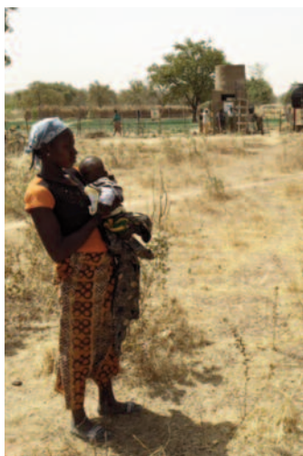
Op een vrouwentuinbouw- coöperatie elders in Burkina Faso.

Het aantal consulten in de polikliniek is toegenomen met 20%, er zijn 2,5 keer zoveel opnames.