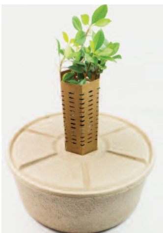
Voorbeeld van een cocoon.

De medicijnen (moeten) worden geadministreerd en verkocht. Door personeelproblemen en teveel gratis medicijnuitgiften was er structureel een financieel probleem: niet genoeg geld voor aanschaf van nieuwe medicijnen, de voorraad wordt niet op peil gehouden. Mede op aandringen van SMO is een vrouw uit het dorp opgeleid in een apotheek in Ouagadougou. Eind 2017 al met een positief resultaat: 68% van de medicijnen wordt betaald (in 2016 46%).