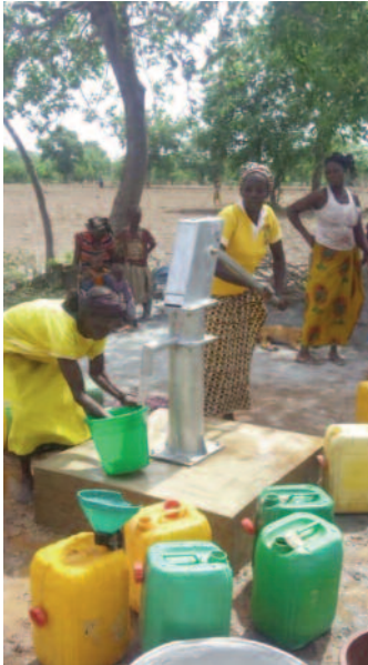
Prioriteit in 2018: de aanleg van twee geboorde waterputten met pomp.

Na een spectaculaire stijging van het aantal bevallingen in 2016, is er in de kraamkliniek in 2017 maar één geboorte meer. We kunnen er slechts naar gissen of dit een gevolg is van het aantal consulten voor geboortepanning, dat in 2017 bijna verdubbelde: van 43 naar 83. Patiënten van de polikliniek betalen voor consulten en behandelingen (€ 0,15) en voor opnames (€ 0,76). Voor de kraamvrouwen zijn consulten, onderzoeken en medicijnen gratis; voor begeleiding bij de bevalling en opname in de kraamkliniek betalen zij een vergoeding, resp. € 1,15 en € 0,30.